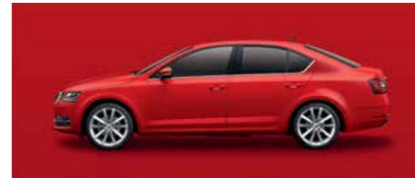
CORRIDA RED UNI