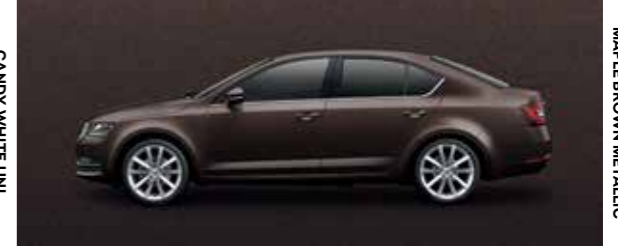
MAPLE BROWN METALLIC