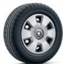
15" SIDUS hub covers