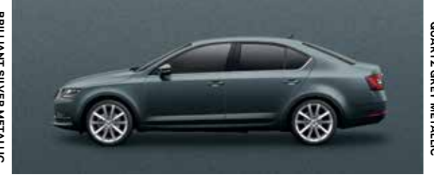
QUARTZ GREY METALLIC