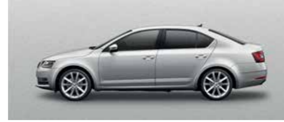
BRILLIANT SILVER METALLIC