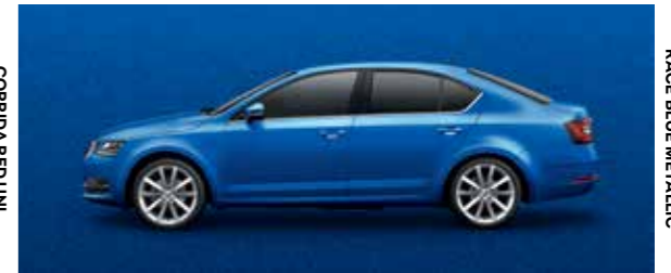
RACE BLUE METALLIC