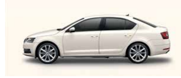
CANDY WHITE UNI