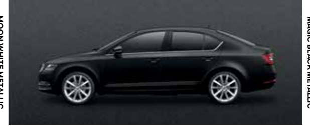
MAGIC BLACK METALLIC