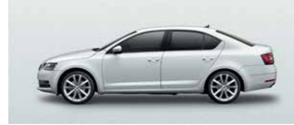
MOON WHITE METALLIC