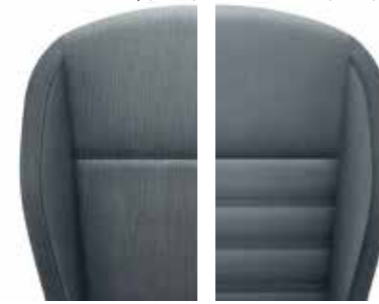
Active Black/Grey (fabric) Ambition Black (fabric)