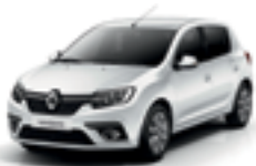
GLACIER WHITE (369)