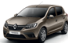
BROWN VISION (CNM)