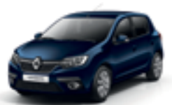
NAVY BLUE (D42)