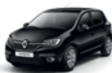
PEARL BLACK (676)