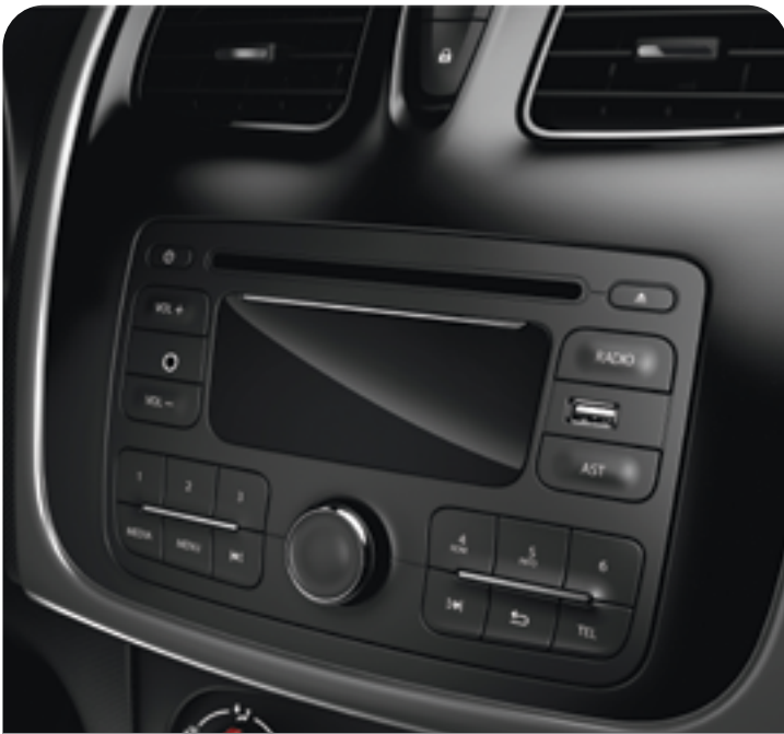
RADIO, CD-MP3,USB,AUX & BLUETOOTH