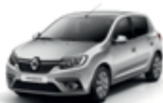
HIGHLAND GREY (KQA)