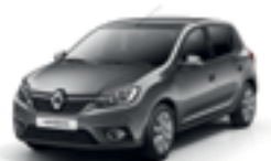
COMET GREY (KNA)