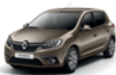
DUNE BEIGE (HNP)