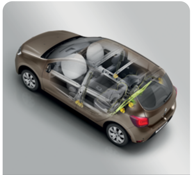
DRIVER & PASSENGER AIRBAGS