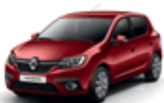
FUSION RED (NPI)