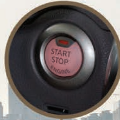
Start Stop Button