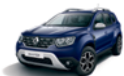
NAVY BLUE (D42)