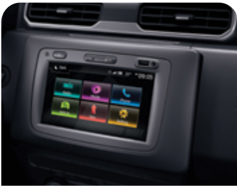
MEDIA NAV. SYSTEM, 7" TOUCH SCREEN