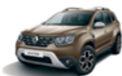
MINK BROWN (CNM)