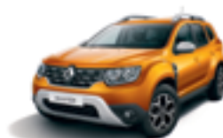
ATACAMA ORANGE (EPY)