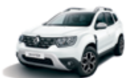
GLACIER WHITE (369)