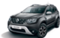
COMET GREY (KNA)