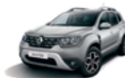
HIGHLAND GREY (KQA)