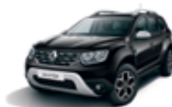
PEARL BLACK (676)