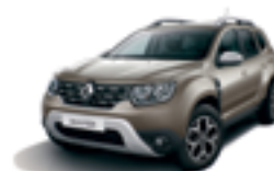
DUNE BEIGE (HNP)