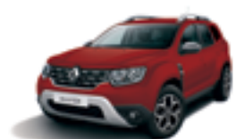
FUSION RED (NPI)