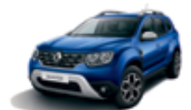
IRON BLUE (RQH)