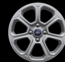
16" Alloy wheels (Sport & Titanium)