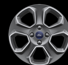
16" Alloy wheels (Trend)