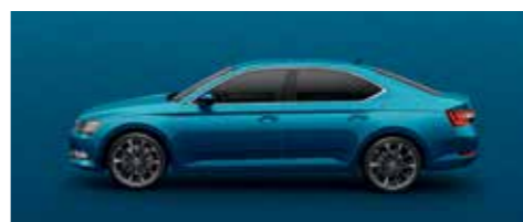
LAVA BLUE METALLIC