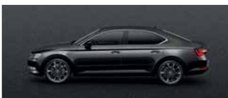
MAGIC BLACK METALLIC