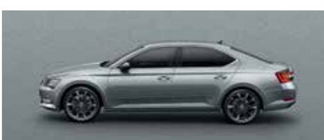
BUSINESS GREY METALLIC

DISCLAIMER : SUBJECT TO CHANGE WITHOUT NOTICE