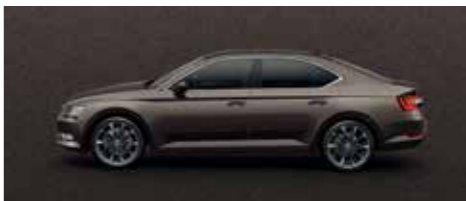
MAGNETIC BROWN METALLIC