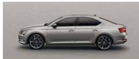
CAPPUCCINO BEIGE METALLIC