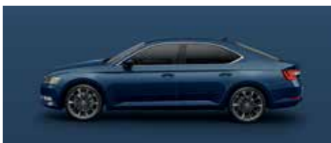
PACIFIC BLUE UNI