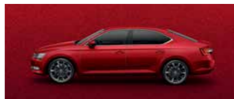
VELVET RED METALLIC