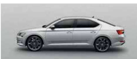
BRILLIANT SILVER METALLIC