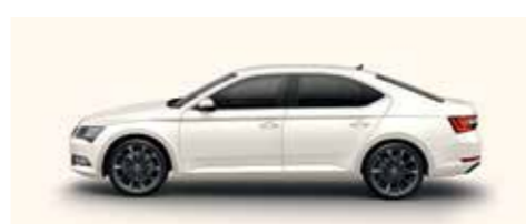
CANDY WHITE UNI