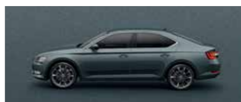
QUARTZ GREY METALLIC