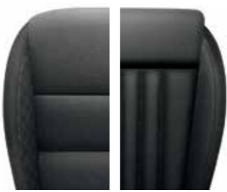
Black Fabric - ACTIVE Black leather - AMBITION